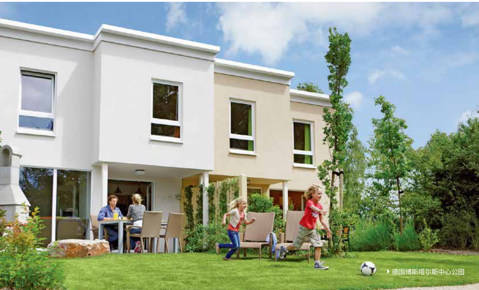
▶ 德国博斯塔尔斯中心公园