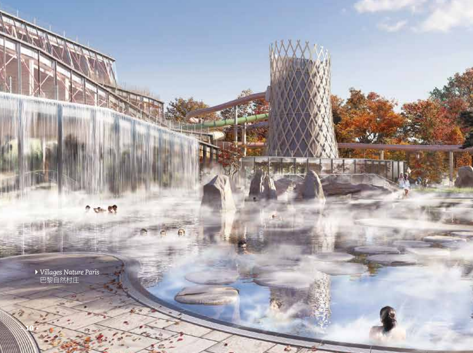
▶ Villages Nature Paris 巴黎自然村庄