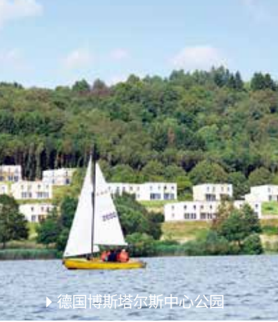
▶ 德国博斯塔尔斯中心公园