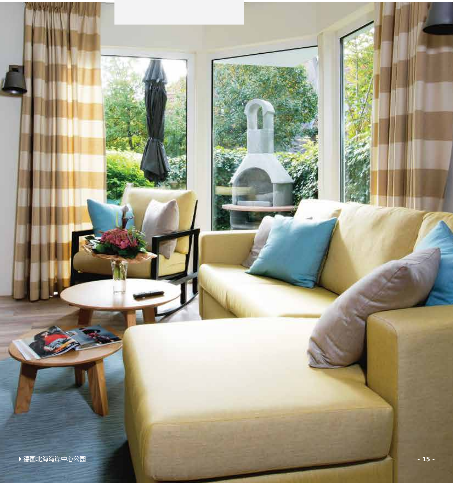
▶ 德国北海海岸中心公园