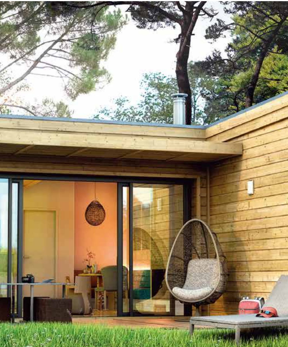
▶ 法国黄鹿林中心公园