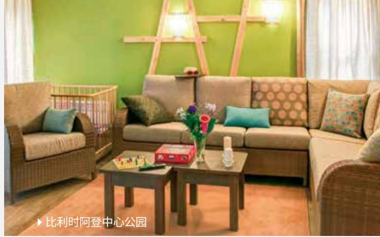
▶ 比利时阿登中心公园