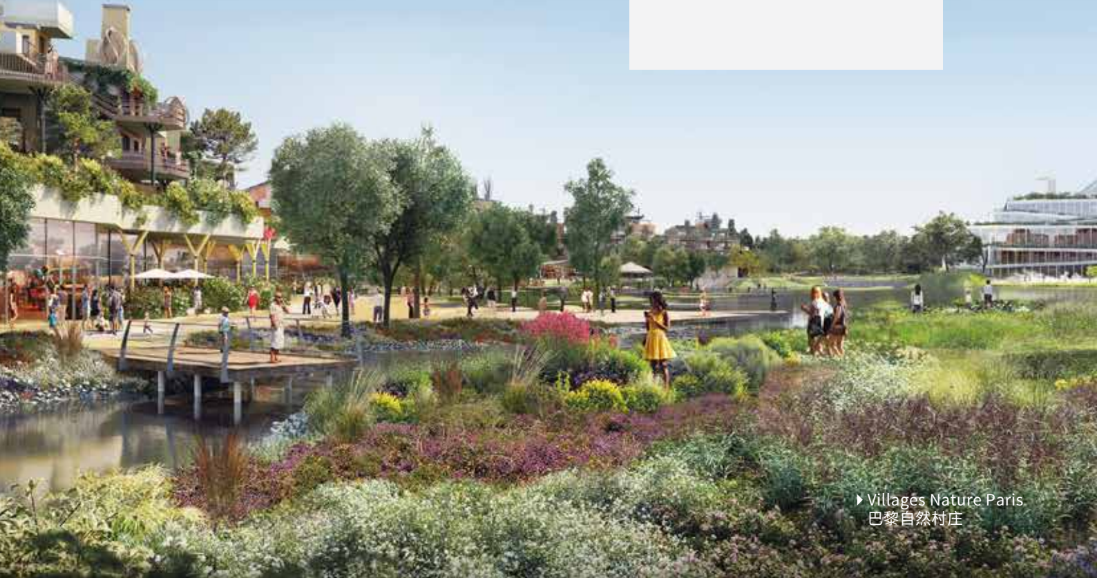
► Villages Nature Paris 巴黎自然村庄

在法国，对新建旅游房产进行包租型房产投资时，投资者可以收回增值税。选择PVCP集团，您在购买时无需预先支付增值税，只需直接支付不含增值税的价格。