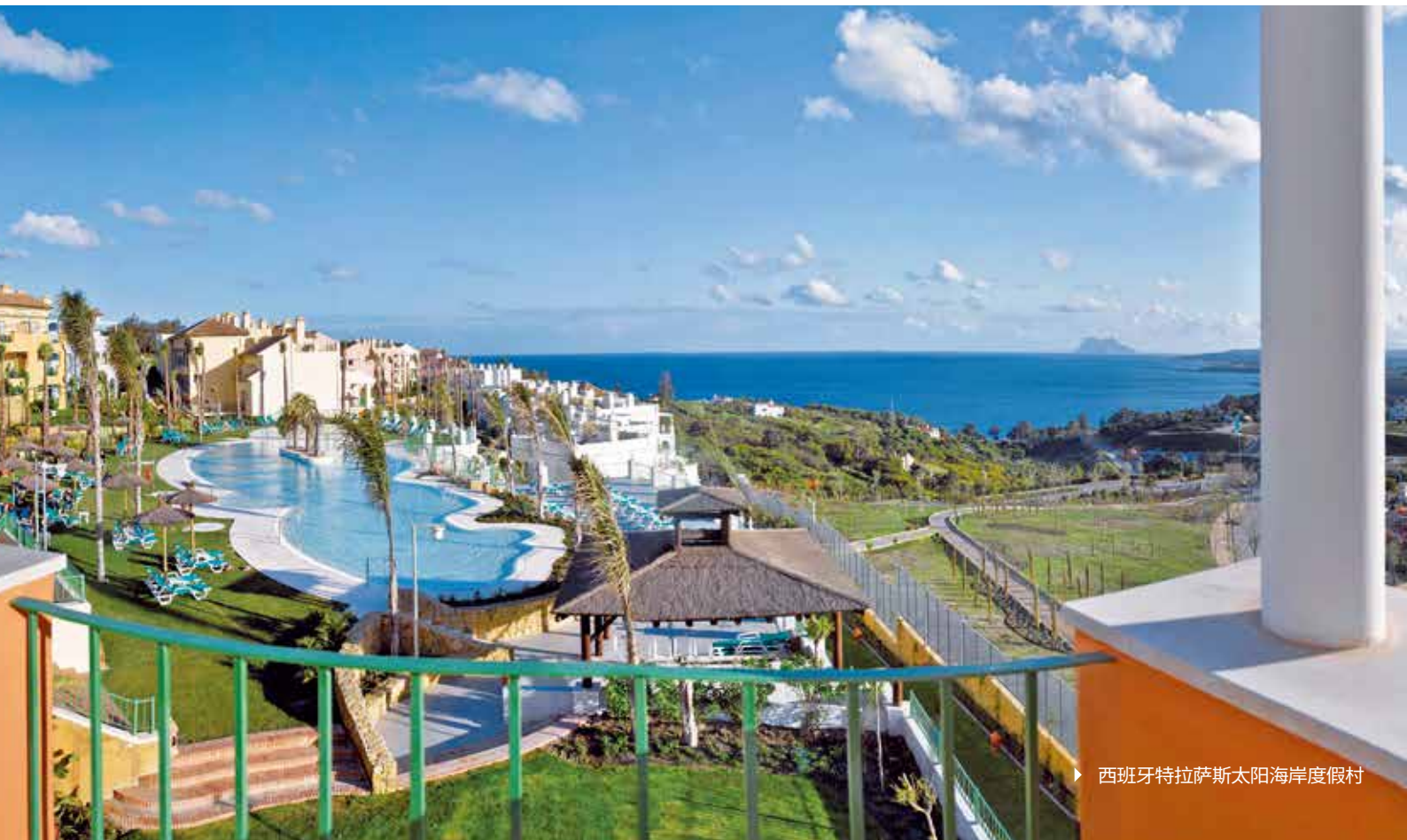
▶ 西班牙特拉萨斯太阳海岸度假村