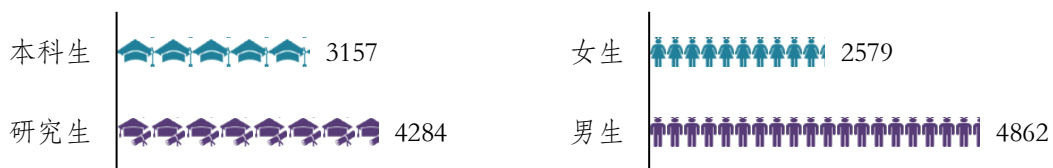
图 1 毕业生学历和性别构成

清华大学 2021 届毕业生共 7441 人 1 ，与往年相比整体上有所增加。其中，本科生 3157 人（42.4%）、硕士生 2437 人（32.8%）、博士生 1847 人（24.8%）；男生 4862 人（65.3%）、女生 2579 人（34.7%），男女比例为 1.9:1（见图 1）。